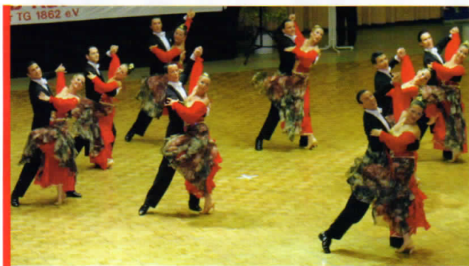
Mit einer Choreografie zur Musik „Pirates of the Caribbean“ tanzten sich die Paare aus Gießen in die 2. Bundesliga.

Vor knapp 600 Zuschauern tanzten sechs Mannschaften der Regionalliga Standard um den Aufstieg in die 2. Bundesliga. Vom außerhalb der Halle herunterkommenden Regen und damit einhergehenden frischeren Luft war in der Halle nichts zu spüren. Im Gegenteil, die ausgelassene Stimmung und die Begeisterung der Zuschauer in der Walter-Köbel-Halle in Rüsselsheim heizte die Halle immer mehr auf.